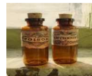
CRR ANTIDOTI EMILIA ROMAGNA